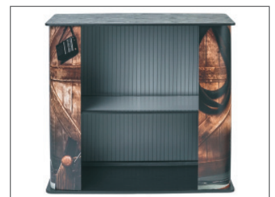
ein Einhängboden optional