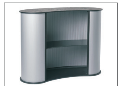
ein Einhängboden optional